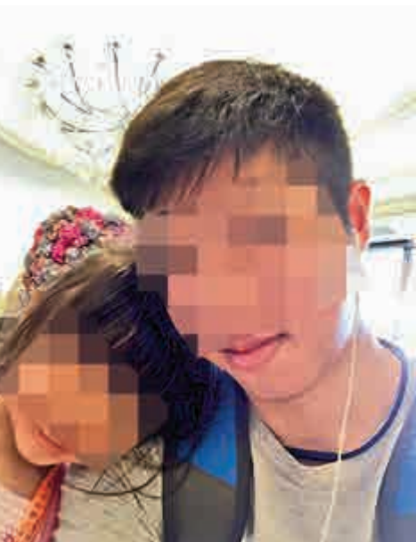
▶虐兒案男疑犯上載與女童溫馨合照 fb圖片