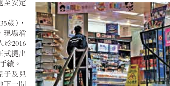
▲警員封鎖發生傷人案的便利店調查

從懷中取出一把長約12吋的生果刀，揮刀襲擊廖婦臉。救護員到場，為廖婦敷治及送院。警員發現由便利店至青山公路新墟段外，有長約100米的血路，警員追至景峰輕鐵站，在路邊草叢檢獲獲有利刀的紅色膠袋，並於輕鐵站截獲男疑犯。