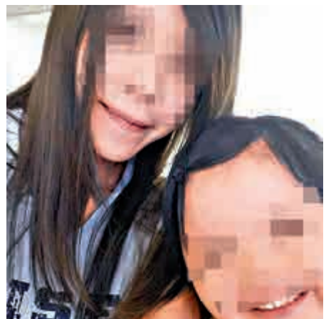
▲屯門虐兒案被捕的繼母與女兒合照