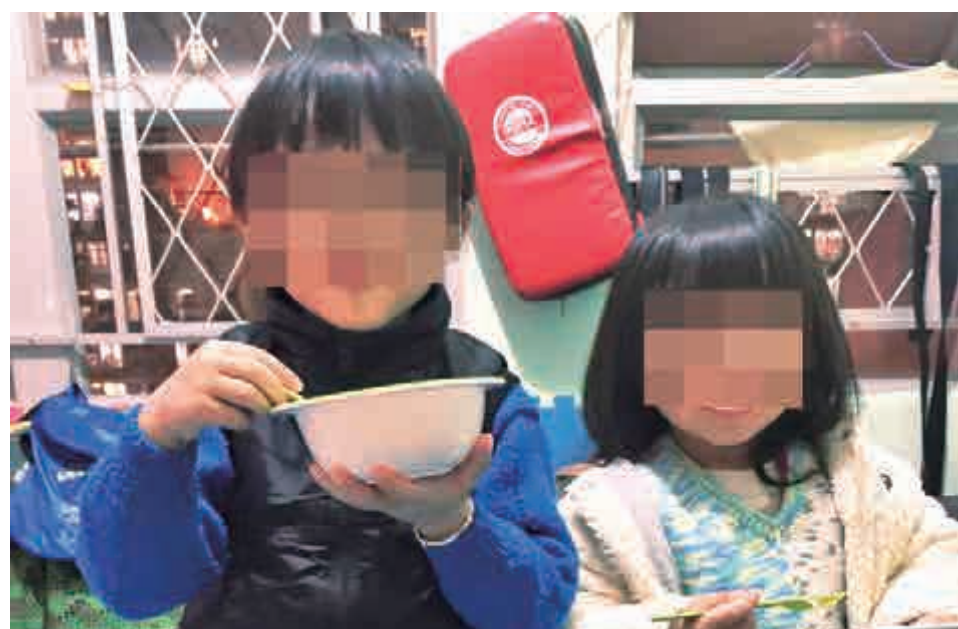
▲fb上載小兄妹早年照片，活潑可愛