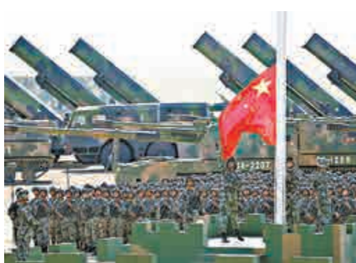
▲軍地預撥70%軍糧指標，為部隊練兵備戰提供充足軍糧保障 資料圖片

部署，要求軍地各級嚴格按照軍事鬥爭後勤準備要求和應急需要，及時協調調整特種儲備糧儲備庫點布局，嚴格落實特種儲備糧儲備庫點制度，做到數量充足、質量良好。各級糧食、財政部門根據部隊任務需求及時修訂完善軍糧保障預案，結合部隊演習訓練，定期組織應急保障演練。同時，軍地強化供應管理，指導各級及時將購糧指標撥付部隊，做好年度軍糧帳目決算，配合財務部門啓動新的軍糧差價補貼機制，不斷提升軍糧標準化供應、科學化管理水平。