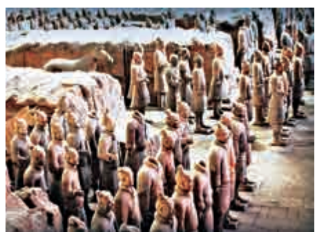
▲兵馬俑已接待200多位國家元首和政府首腦參觀

發熱議，除了討論法國總統和兵馬俑的故事外，亦有網友在網上向法國總統推薦起了西安美食。有網友認為，西安美食和法國大餐有很多相通之處。比如說，肉夾饃類似漢堡，西安油酥餅類似法國麵包，而法國人也吃羊肉，羊肉泡饃也非常合適法國人口味。所以，馬克龍來西安，肉夾饃和羊肉泡饃都可以作為首選推薦給他。