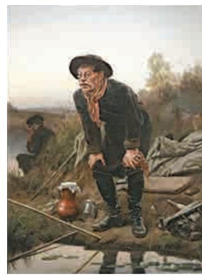
▲彼羅夫作品《釣魚者》，布面油畫，一八七一年