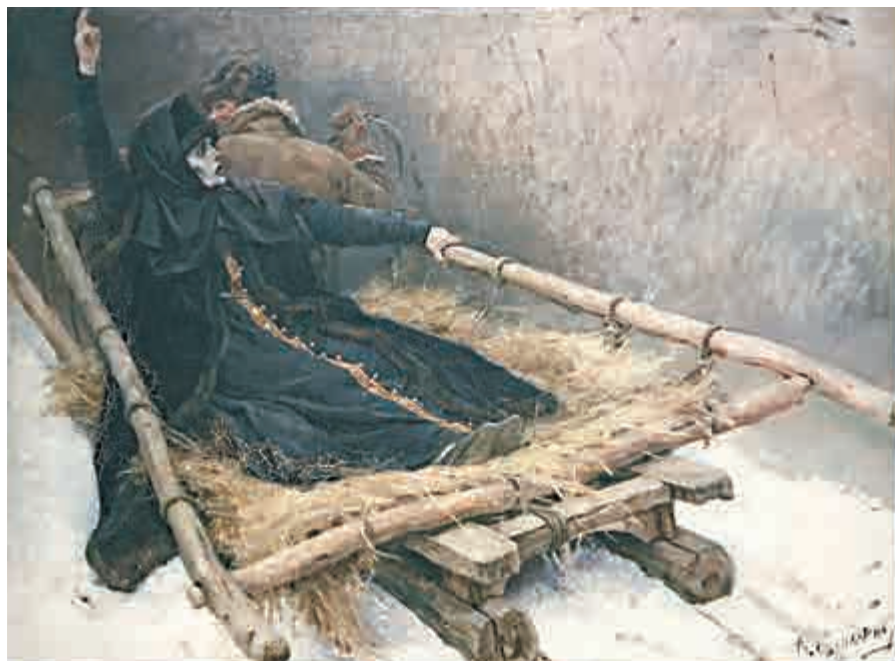
▲蘇里科夫作品《雪橇上的女貴族莫洛佐娃》，布面油畫，一八八六年

對於中國美術界而言，最初引入寫實主義的理念，有賴於徐悲鴻等一批留法藝術家的傳播和發揚。到了新中國成立以後，俄式寫實成為了國內「西學」的唯一導師，直到今天，活躍在畫壇的著名藝術家，均從留蘇或是學蘇起步的：靳尚誼、詹建俊、邵大箴、全山石、陳逸飛、陳丹青等等。其中，又以「巡迴展覽畫派」（簡稱「巡迴畫派」）的畫家和作品最為受到