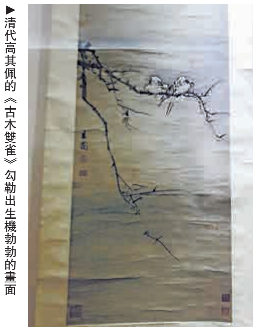
▶清代高其佩的《古木雙雀》勾勒出生機勃勃的畫面