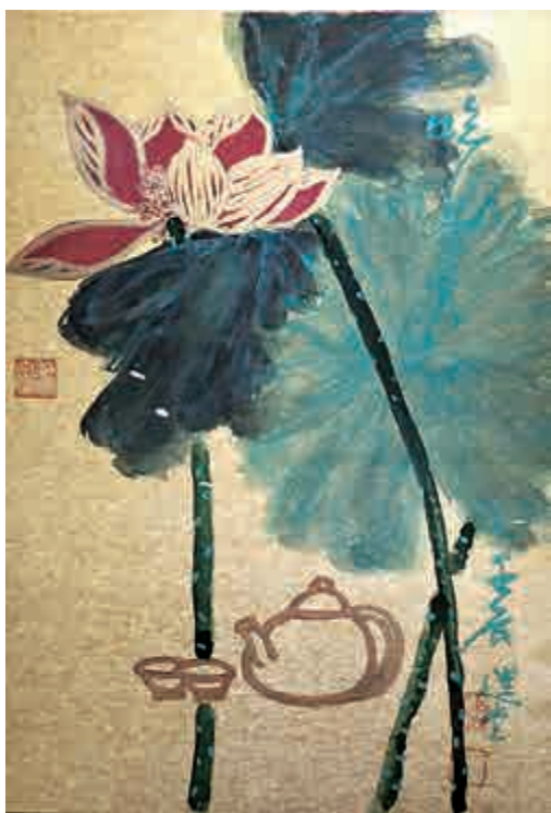
▲饒宗頤作品《喫茶去》