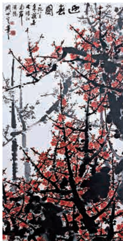
▼饒宗頤《六祖像》及書法是難得一見精品 ▲關山月的《迎春圖》是本次展覽的一大亮點