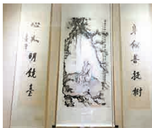
◀「聽濤軒藏珍——聽濤軒收藏中國書畫展」昨日在廣州增城開幕