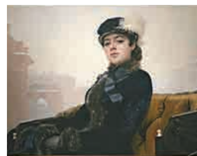
▲克拉姆斯柯依作品《無名女郎》，布面油畫，一八八三年