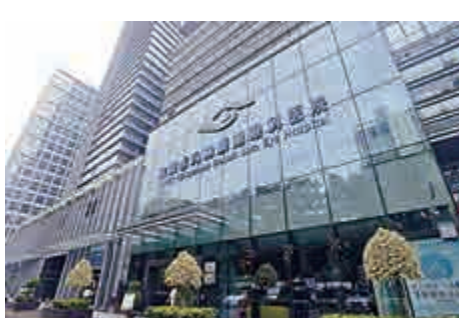
▲希瑪眼科上市初期料掀起一場資金追逐戲碼

長線投資方面，由於希瑪眼科始終不是騰訊「親生仔」，估計股價走勢與其他騰訊系子公司類似，長線投資價值不算特別大。該股周一（8日）截止認購。