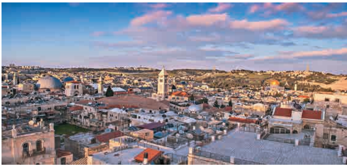
◀耶路撒冷，一座因「神」而生又為「神」所累的城市 網絡圖片

誠哉斯言，我們一生中未必會去耶路撒冷，但每個人都需要有一個精神的避風港，讓我們在面對生活時充滿勇氣和力量，因此，讀者不一定記得住《耶路撒冷三千年》裏那長長的人名、地名或錯雜複雜的歷史糾葛，卻可以感受那些發生在耶路撒冷的關於信仰、意志和心靈的往事，並從中得到啓發。我想，這大概就是大多數讀者閱讀本書時應有的態度和收穫吧！