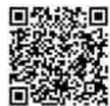
掃描 QR Code 上大公網瀏覽更多讀書資訊