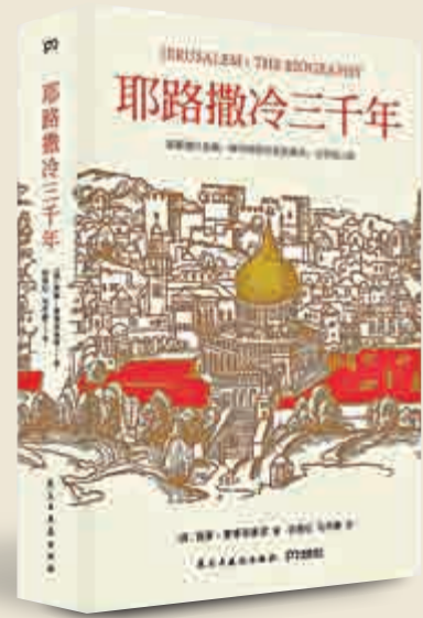
▲西蒙·蒙蒂菲奧里著，張倩紅、馬丹靜譯《耶路撒冷三千年》（民主與建設出版社，二〇一七年）