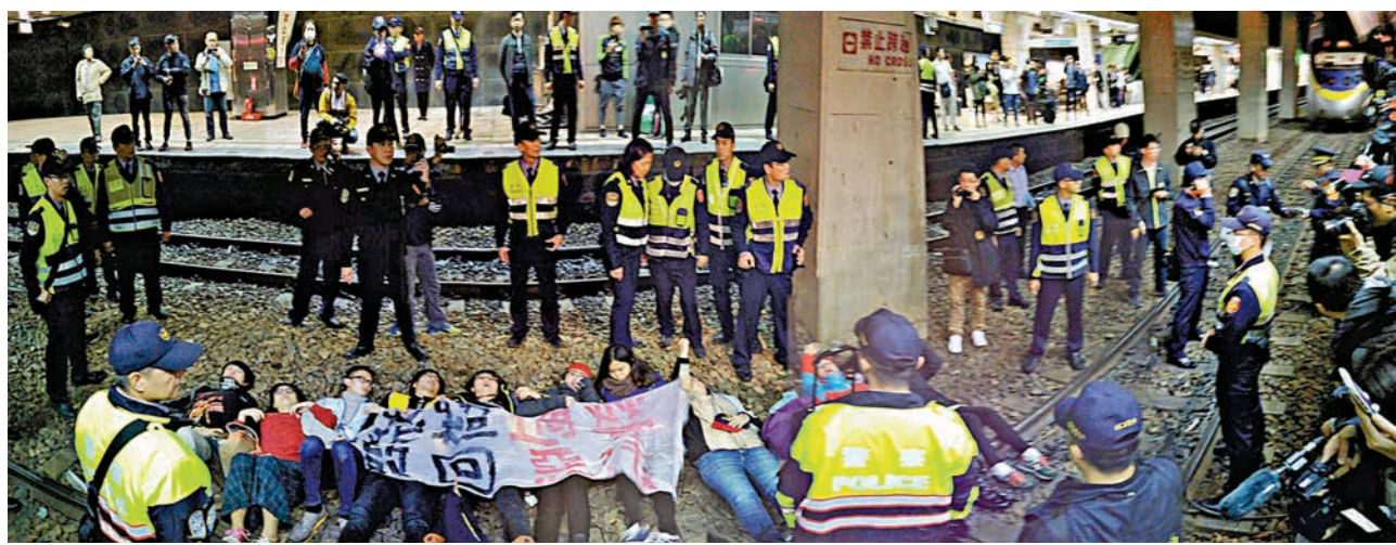
不滿台當局修改勞基法，多名勞團成員8日晚間赴台北火車站跳下月台臥軌抗議，警員到場戒備。

此外，部分勞團夜宿立院，準備9日繼續抗爭。勞基法在民進黨上台第一次修改後已引發爭議；資方不滿加班費計算方法以及僵化的假期安排制度，勞方則批評當局違背「實施週休二日不刪減法定假期」的承諾。如今第二次修法，又被質疑放寬加班時限，因而再度引起不滿。