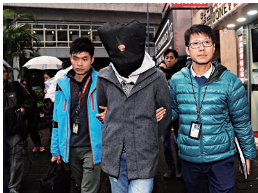
▲涉入侵大航和金怡假期的男子被捕

究竟比特幣從何而來？它屬加密貨幣（Cryptocurrency），透過芯片組運算，密碼學確保交易安全，以「區塊鏈」（Block Chain）做交易記錄，特色是去中心化（decentralization），即全球通用，不需第三方機構或個人管理，任何人皆可參與比特幣活動，以私鑰作為數位簽章，透過稱為「挖礦」的電腦運算獲得。比特幣交易不只限於一枚計，可以分割成小數點後8位（0.00000001）逐少交易。