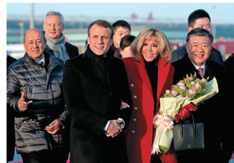
法國總統馬克龍與夫人布麗吉特抵達西安

法蘭西民族的大國夢想同中華民族偉大復興的中國夢是相通的。我們有理由相信，勇於逐夢的中法兩國攜手同行，一定會圓夢新時代，開拓新未來。