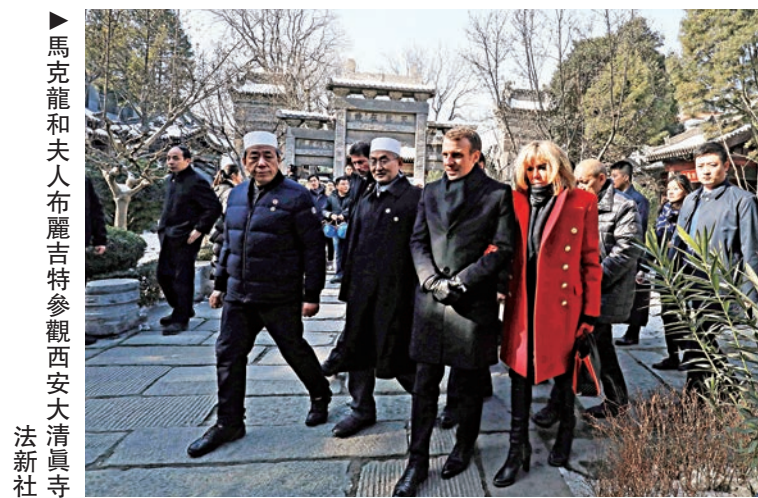
馬克龍和夫人布麗吉特參觀西安大清真寺