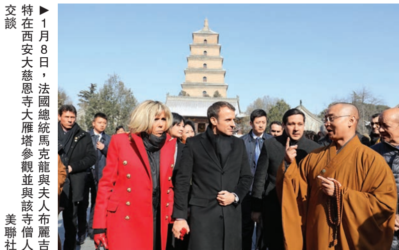
1月8日，法國總統馬克龍與夫人布麗吉特在西安大慈恩寺大雁塔參觀並與該寺僧人交談