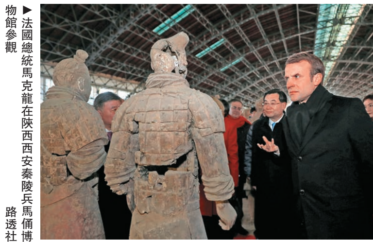
法國總統馬克龍在陝西西安秦陵兵馬俑博物館參觀