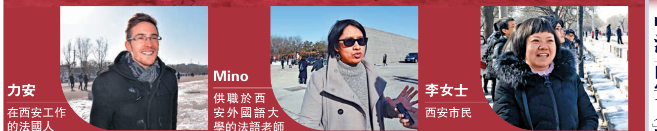
力安 在西安工作的法國人