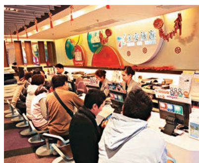
▲自貿區內註冊的中外合資旅行社可經營內地居民出境遊 網絡圖片