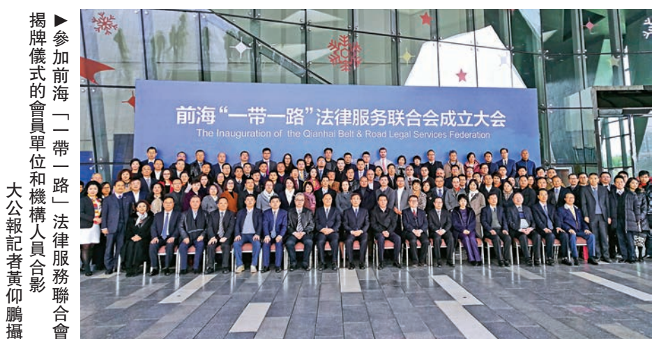
►參加前海「一帶一路」法律服務聯合會揭牌儀式的會員單位和機構人員合影

「一帶一路」法律服務聯合會是經全國人大常委會港澳基本法委員會和司法部同意，由深圳市司法局、前海管理局和深圳市貿促委聯合主管的社團組織，聯合會將主要提供會員合作、項目對接以及法律諮詢三方面服務。