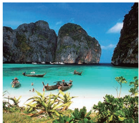
▲PP島的燦爛陽光和柔軟沙灘，令它成為泰國新興度假天堂

PP島（Phi Phi Islands）是泰國一個新興的度假天堂，有燦爛陽光和柔軟沙灘，位於布吉島與泰國本土同樣屬於南部地區的甲米府之間的海面上，更棒的是遊客比泰國布吉島少，海水更加乾淨，是海島遊的最佳選擇。