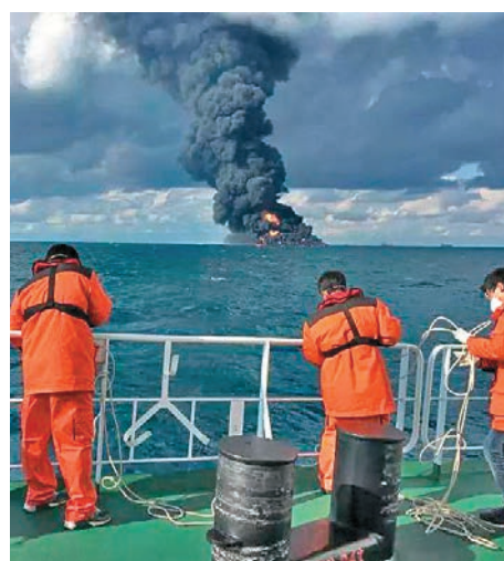
▲「桑吉」輪燃燒時濃煙冲天

1月6日19時51分左右，巴拿馬籍油輪「桑吉」輪與中國香港散貨船「長峰水晶」輪在長江口以東約160海里處發生碰撞，導致「桑吉」輪起火，32名船員遇險。事故發生後，中國海上搜救中心、上海海上搜救中心迅速啟動應急預案，盡最大努力全力開展人命救援。1月8日，救助力量尋獲一具外籍船員遺體，經確認為「桑吉」輪船員。1月13日上午，上海打撈局4名救助人員登上「桑吉」輪，發現兩具遇難船員遺體帶回，同時帶回該船舶「黑盒」。