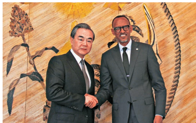
▲1月13日，中國外交部長王毅（左）在盧旺達首都基加利總統府會見盧旺達總統卡加梅

王毅表示，中非合作論壇是中國和非洲國家開展集體對話、深化互利合作的重要渠道，也是世界上規模最大、成效最好的南南合作平台。3年前，論壇約翰內斯堡峰會取得巨大成功。今年輪到中國舉行新一屆中非合作論壇。根據非洲國家積極迫切願望，中方決定將論壇提升為峰會。習近平主席和論壇非方共同主席國南非總統將聯名邀請論壇所有成員方領導人出席。剛才我向卡加梅總統當面轉達邀請，卡加梅總統非常愉快地接受邀請，表示將以盧旺達總統和非洲聯盟主席雙重身份屆時赴華出席論壇峰會。我們願同非洲朋友加強