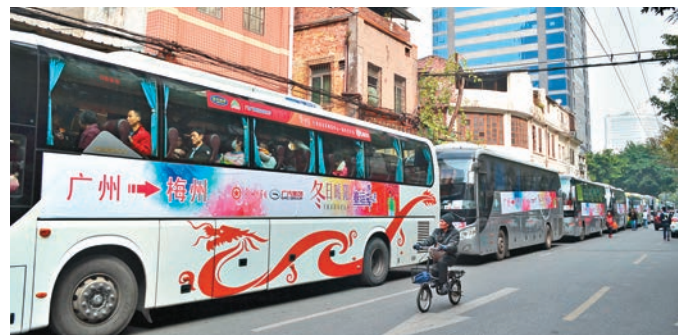
▲廣州開通的「冬日暖陽」直通大巴

公路方面，主辦方攜手廣汽集團開設15條返鄉路線，提供15輛大巴，免費送約750名來穗務工人員返鄉，並將2月9日起發車開往各地。