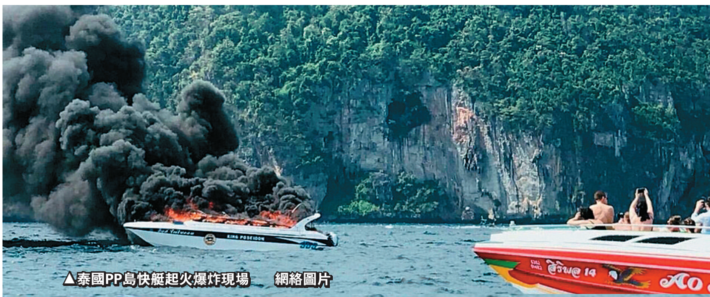
▲泰國PP島快艇起火爆炸現場

由於在休閒和飲食等文化上的熟悉，近年中國遊客大批湧入泰國。據調查，泰國一直位列中國遊客最青睞的10大旅遊目的地。與此同時，隨着海島度假模式在國內的興盛，擁有眾多成熟度假島嶼的泰國也隨之得益，除了曼谷、芭堤雅和清邁等熱門旅遊城市，PP島、蘇梅島等度假島嶼亦成為近年中國遊客到泰國度假的熱門之選。