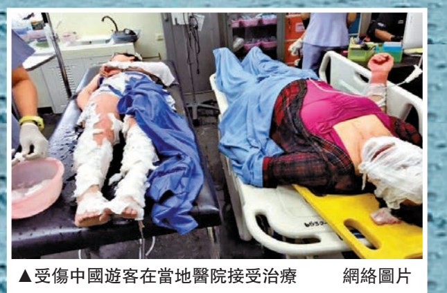
▲受傷中國遊客在當地醫院接受治療