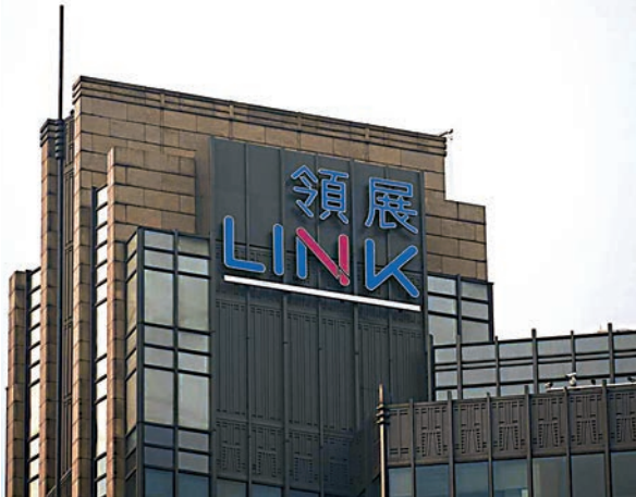
▲坐落浦西核心商區的領展企業廣場，外牆懸掛了相等於兩層樓高的中英文名字

憑藉優越位置，頂尖功能及卓越設計，領展企業廣場的團隊更花了約一年時間，進行一系列優化改造及提升物業營運的工程，為租戶提供更環保及更佳辦公環境。並成為中國建築物中取得LEED-EBOM鉑金級綠色建築認證的最高分項目之一，物業發揮其地標性商業物業優勢，深受跨國及內地大型企業、專業和金融服務公司青睞。