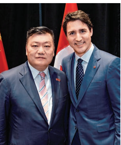
▲胡劍江會長和加拿大總理特魯多合影留念

、加拿大國會議員伍儀儀等加國政府官員和商界代表，就加強香港和加拿大的交流合作場所所欲言。