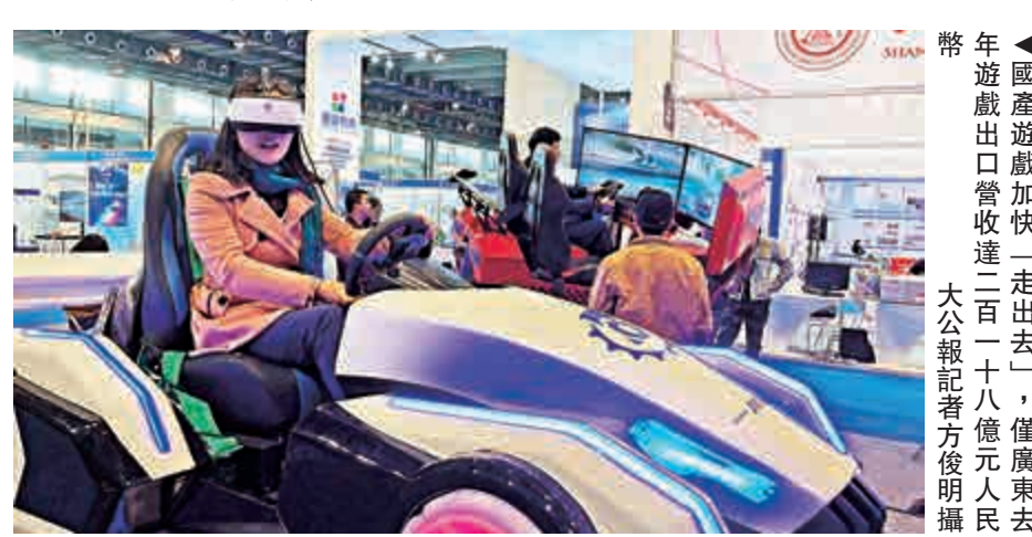
國產遊戲加快「走出去」，僅廣東去年遊戲出口營收達二百一十八億元人民幣 大公報記者方俊明攝

2017年度遊戲產業「金鑽榜」亦在此間揭曉，騰訊、網易位居「最具影響力企業」前兩位，而《王者榮耀》、《大話西遊》手遊榮獲「最佳國產遊戲」冠軍。