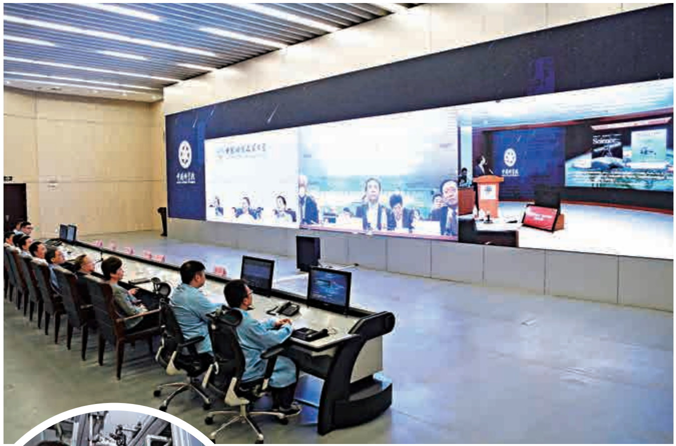
去年九月，結合「墨子號」衛星，中國科學家成功與奧地利實現了世界首次洲際量子保密通信 資料圖片

論文審稿人稱讚，洲際量子保密通信網絡實驗是「重大技術成果」，「任何不用衛星的方法（如正在發展的量子中繼器）可能至少需要10年的時間才能接近這個實驗的結果。」