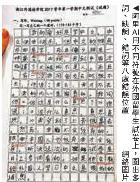
阿里AI用不同符號在外國留學生試卷上，圈出多詞、缺詞、錯詞等八處錯誤位置 網絡圖片