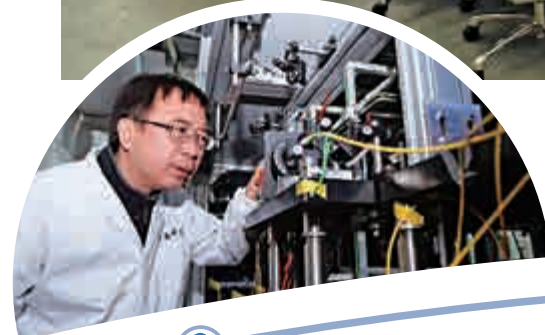
「墨子號」首席科學家潘建偉院士在中國科大大量子存儲實驗室內了解科研情況 資料圖片