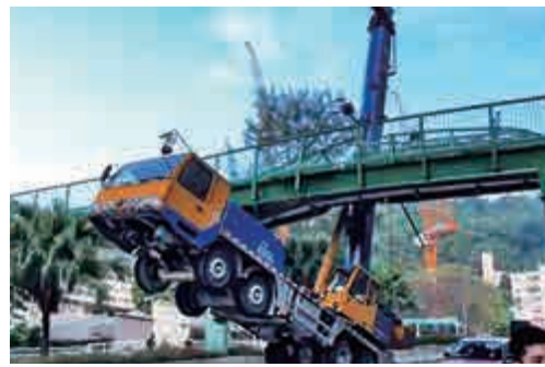
▲吊臂車司機被困一小時才被救出，送院治理

有保險業人士指出，商用車的第三者保險的投保額一般為100萬元，除非車主加碼投保，否則超過保額的賠償要由車主自行承擔，以修橋費用動輒數百萬元計，車主恐破產。