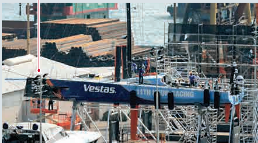
▲肇事帆船船頭損毀嚴重