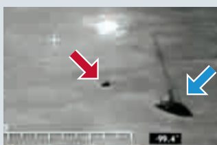
▲發生帆船(藍箭咀)與內地漁船(紅箭咀)相撞意外現場