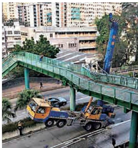
▲柴灣長命斜天橋被吊臂車撞毀