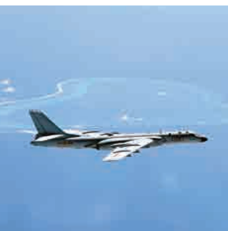
▲空軍轟-6K飛機在黃岩島等島礁附近空域巡航

1月17日晚，美國「霍珀」號導彈驅逐艦未經中國政府允許，擅自進入中國黃岩島12海里內海域，中國海軍「黃山」號導彈護衛艦當即行動，對美艦進行識別查證，並予以警告驅離。