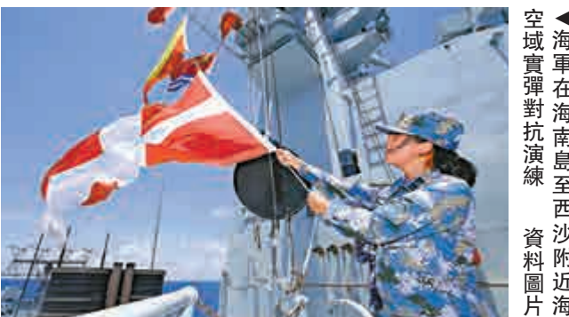
▲海軍在海南島至西沙附近海域實彈對抗演練 資料圖片

報告認為，台灣民進黨當局「切割大陸、迎合美日」的南海政策給兩岸南海合作帶來了新的挑戰，台灣當局應以更加明智的態度，維護兩岸在南海的共同利益。