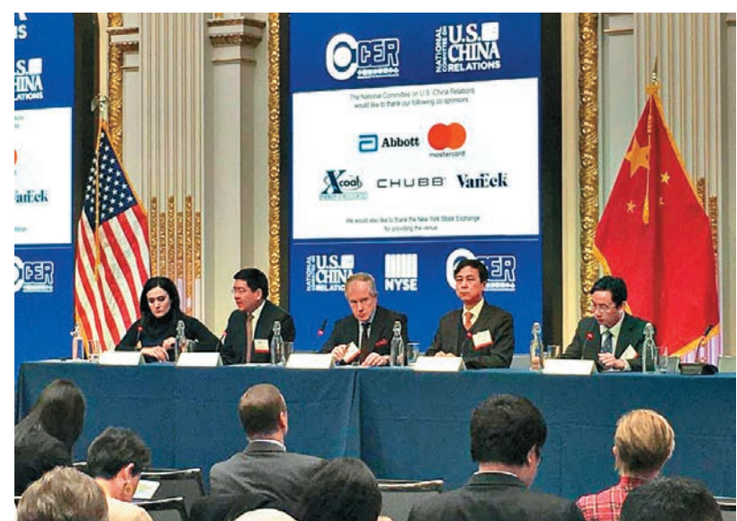
▲美中關係全國委員會和北京大學中國經濟研究中心合辦的「2018中國經濟預測」論壇9日上午在紐約證券交易所舉行

拉迪認為，貿易戰必然是兩敗俱傷，但與中國相比，特朗普承受痛苦的能力更弱，在壓力之下，他將不得不三思而行。他還表示，特朗普的稅改政策，將會進一步推高美國的貿易赤字。