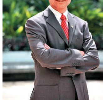
▲嶺南大學校長鄭國漢對續任嶺大校長感到榮幸

現年65歲的鄭國漢，2013年九月出任嶺大校長。早前嶺大校董會大比數通過鄭續任校長，據了解，嶺大有指引訂明，年屆65歲的教學人員續任任期為三年，但沒有訂明有關指引適用於校長任期，會議曾討論其任期應是三年任期後，再由校董會檢視是否續約兩年，或是直接續約五年。嶺大校董會昨日宣布，根據《嶺南大學條例》第15條1款，諮詢諮議會意見後，通過續聘鄭國漢為嶺大校長。