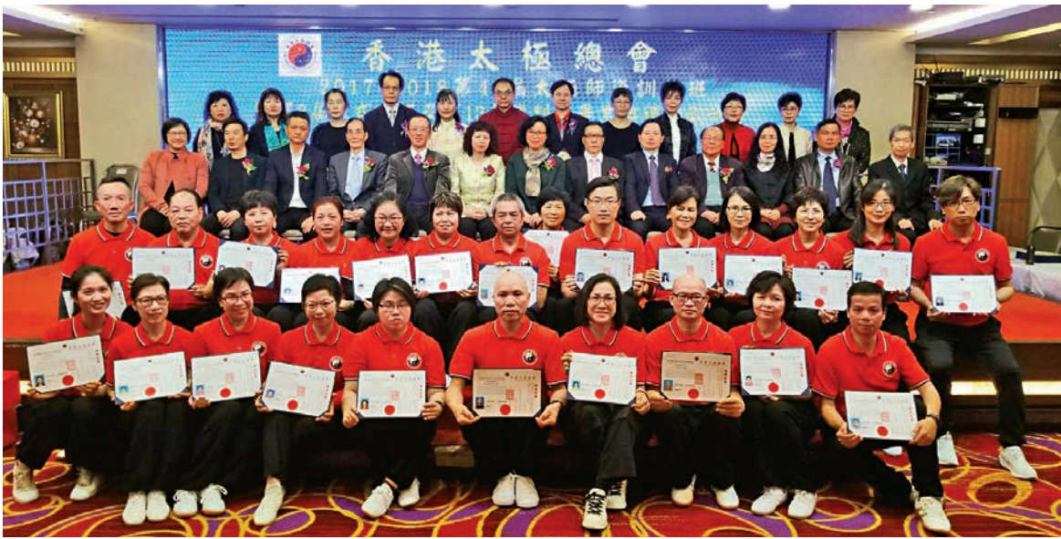
▲香港太極總會第41屆師資訓練班暨第3屆陳式太極及第13屆裁判班畢業典禮大合照

香港太極總會第41屆師資訓練班暨第3屆陳式太極及第13屆裁判班畢業典禮及聯歡晚會在1月20日晚於旺角倫敦大酒樓筵開22席，場面熱鬧，畢業典禮於當晚圓滿舉行。