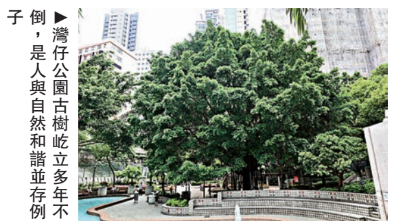
子倒 ▶ 灣仔公園古樹屹立多年不倒，是人類與自然和諧並存例

由香港浸會大學香港有機資源中心舉辦的「全城有機日」，將於3月25日 (星期日) 於中環遮打花園及遮打道舉行。「永續·有機·Post住上」短片拍攝比賽，由即日起接受報名，主題是把「有機」生活融入衣食住行，帶出與大自然和諧並存的訊息，優勝者可贏取新西蘭、日本或台灣雙人來回機票。