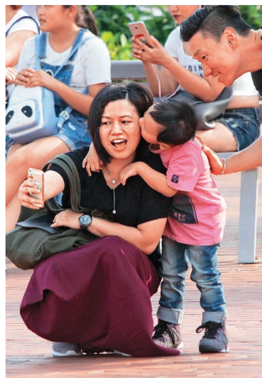
▲ 家庭是培養年輕人的人格和自尊的重要場所