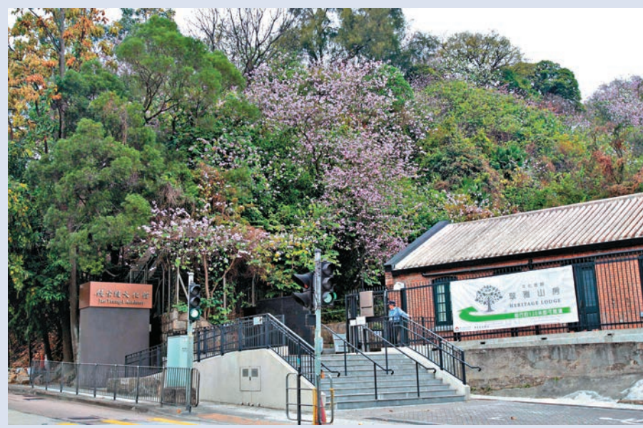
▲ 饒宗頤文化館位於香港九龍荔枝角青山道800號，前身為荔枝角醫院