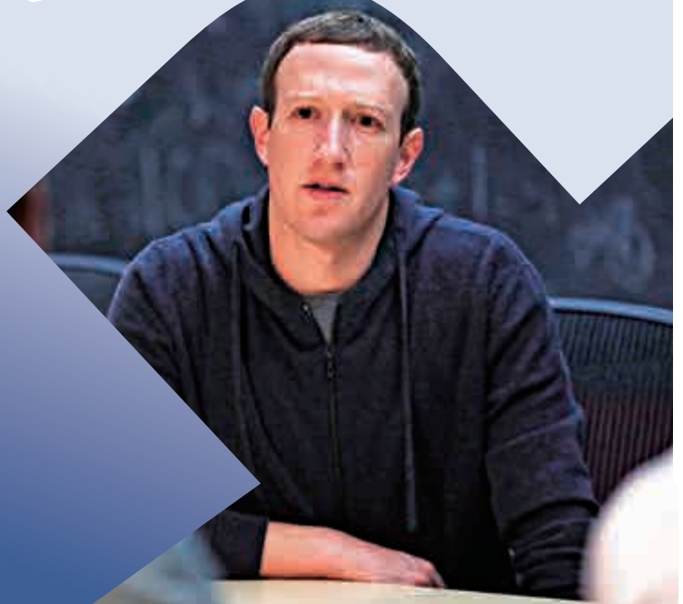
▲社交媒體Facebook創辦人朱克伯格