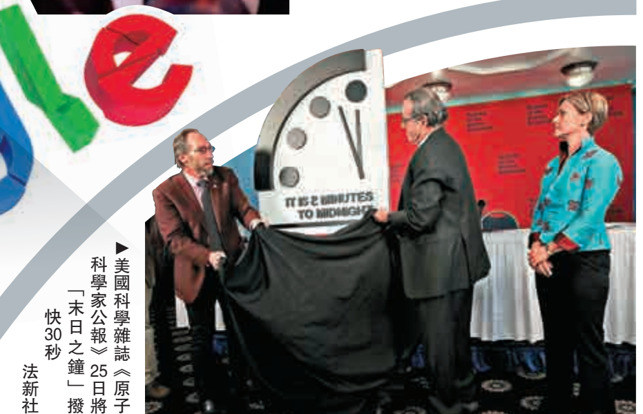
▲美國科學雜誌《原子科學家公報》25日將「末日之鐘」撥快30秒

通過比特幣在海外儲藏財富。「儘管如此也不能改變比特幣是一個典型的泡沫的本質，它和鬱金香熱一樣都是基於誤解。」索羅斯還指出，比特幣的底層技術區塊鏈可以用來幫助移民和家人之間的交流以及幫助他們安全地保管好錢包。