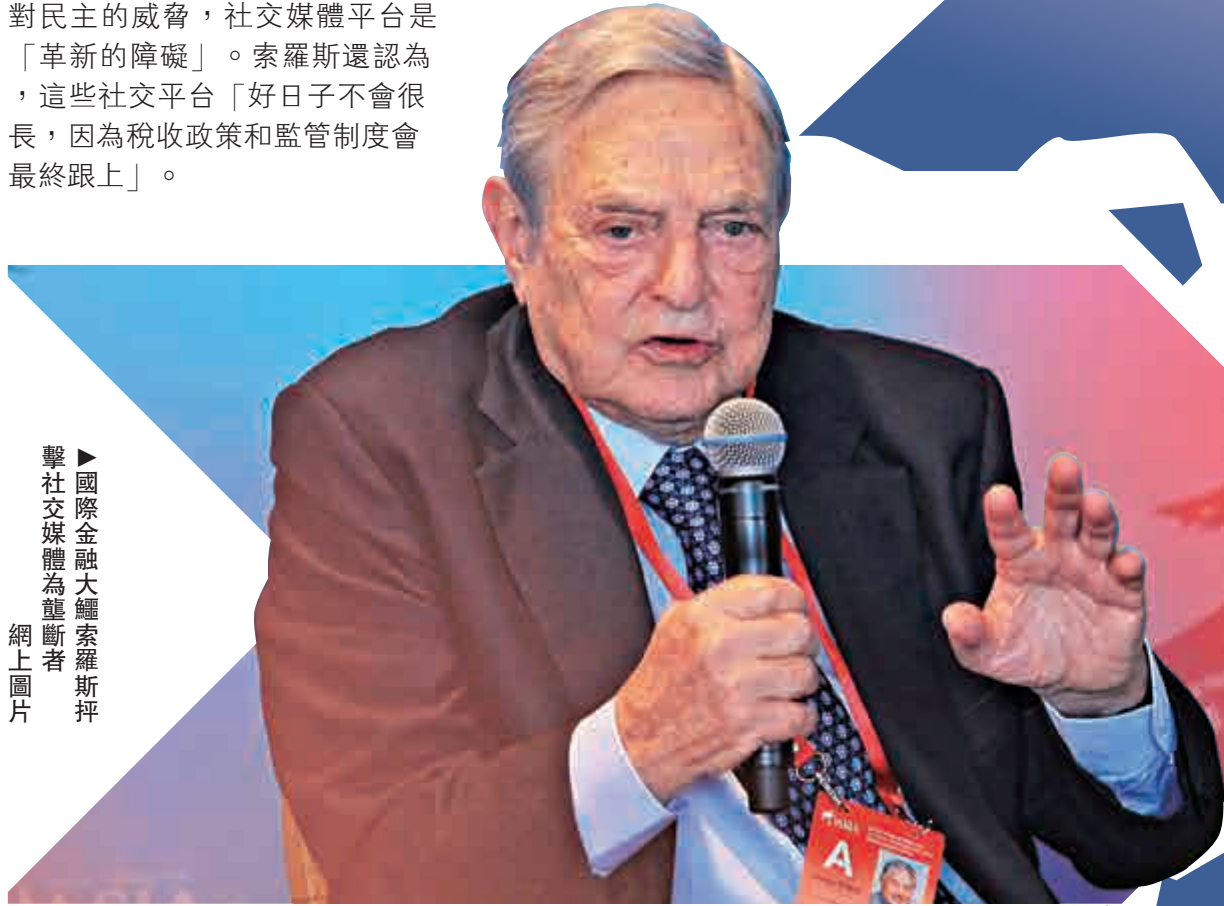
▲國際金融大鱷索羅斯抨擊社交媒體為壟斷者

【大公報訊】據英國廣播公司及《金融時報》報導：億萬富豪投資人喬治·索羅斯在達沃斯世界經濟論壇年度晚宴上向Facebook、谷歌（Google）等公司提出批評，指科技產業的「壟斷」是對民主的威脅，社交媒體平台是「革新的障礙」。索羅斯還認為，這些社交平台「好日子不會很長，因為稅收政策和監管制度會最終跟上」。