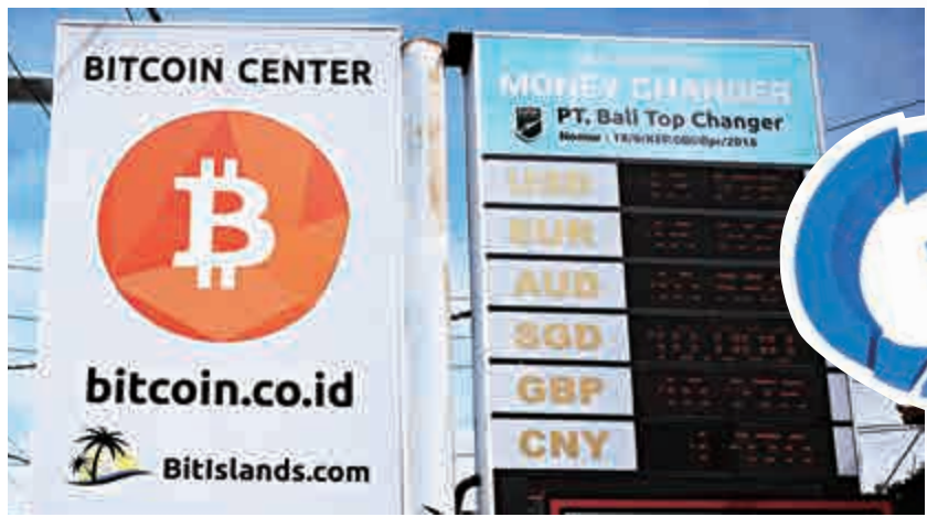
▲印度尼西亞峇里島上的比特幣交易牌