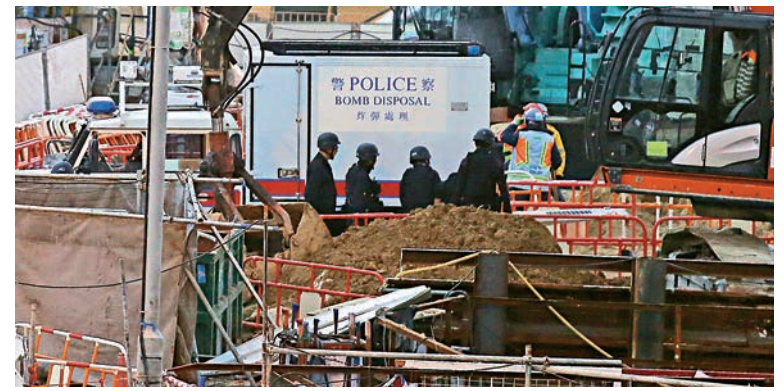
▲爆炸品處理課人員到場協助