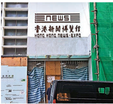
籌建中的香港新聞博覽館

近完成，外圍城隍街的垃圾站已經拆除，並重整了樓梯。館方於近日簡介會透露，設計團隊將隨後進場安裝各項展覽裝置，預計今年第四季度竣工後向社會開放。