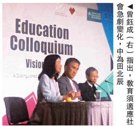
曾鈺成（右）指出，教育須適應社會急劇變化，中為田北辰

曾鈺成發言稱，現時的教育制度有些牢固的觀念，要適應社會急劇變化，需要從教育着手。他稱「不要以為什麼是對學生最好的」，就給了什麼，反而要針對學生需要的、有潛能的，讓學生加以發揮。身為服裝連鎖店老闆的田北辰亦稱，大學收生不應只考量學生成績，對人的關懷、解決問題的能力都同樣重要。