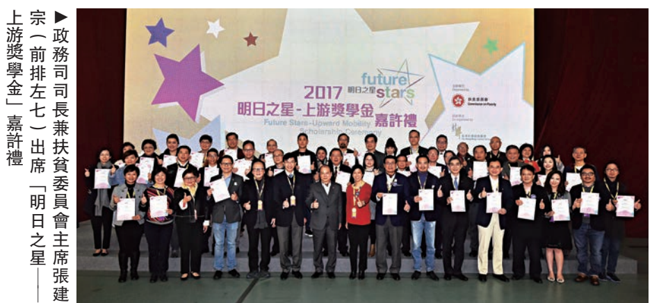
政務司司長兼扶貧委員會主席張建宗（前排左七）出席「明日之星」上游獎學金嘉許禮