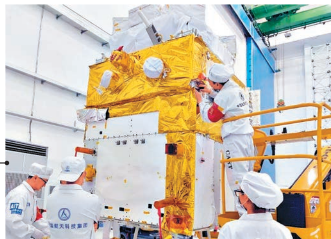
「慧眼」採用的衛星平台是中國航天科技集團公司五院最成熟遙感衛星平台之一 網絡圖片