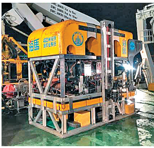
被喻為科考神器的「海馬號」國產深海無人遙控潛水器

通過對「悟空」號的載荷工程參數進行會診，專家判斷事件或是太空中粒子擊中它身上攜帶的某台計算機造成，導致計算機自動重啓。紫金山天文台提出調整指令申請，負責中科院空間中心和西安衛星測控站緊急行動，通過一系列複雜的指令把重新啓動計算機的信號發給「悟空」號，讓「悟空」號火眼金睛重見光明。