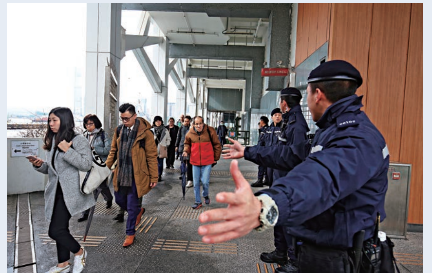
▲在警員協助下，上班族有序疏散