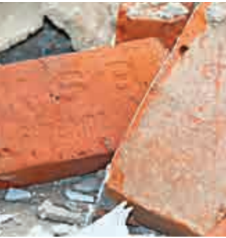
▲被撞碎的舊灣仔警署圍牆的紅磚上KSB字樣

有86年歷史、二級歷史建築物舊灣仔警署，昨日發生撞塌牆事件。警署面向謝斐道一幅約十米長紅磚圍牆連大閘，疑被一輛貨車撞毀倒塌，幸無人受傷。建築署表示，已盡量保留被撞塌的建築物料，以便日後復修之用。古物諮詢委員會主席林筱魯表示，相信無礙該警署的建築及歷史價值。有保育建築學者則向當局獻計，趁這次意外「契機」，考慮應否全面拆牆，開放舊灣仔警署予公眾。