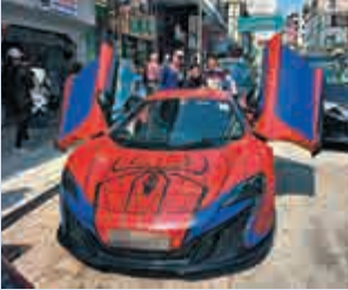
載與友人在蜘蛛俠圖案上