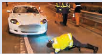
▲警方在啓福道車禍現場調查 電視圖片

【大公報訊】一名24歲青年於昨日凌晨駕駛掛有「P」牌的Aston Martin（雅士頓·馬田）跑車，駛入九龍灣啓德隧道前，在啓福道撞倒正橫過馬路的老翁，老翁被撞上車頭擋風玻璃，再反彈出數米外墮地重傷昏迷，送院搶救不治。