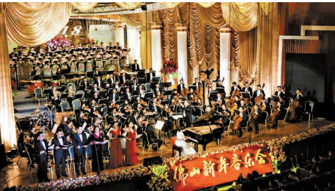
▲佛山新年音樂會演出貝多芬《合唱》幻想曲的場面