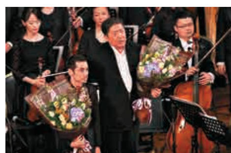
▲「廣交」演出《功夫》後，作曲家安迪·秋保（前排左）上台向大家致意

九交響曲終章《歡樂頌》的影子。「小水井」在《合唱》幻想曲中的四、五分鐘合唱歌聲，顯然未能滿足觀眾（歌者自己亦然）；為此，在余隆指揮下，「小水井」與四位合唱團的獨唱歌手加唱了雲南膾炙人口的民歌《小河水水》，再加唱了伯恩斯坦音樂劇《康迪特》（Candide）中的選曲《讓我們的花園成長》，以「連接」起下半場開始，充滿現代活力氣息的《康迪特》序曲，才進入各方期待的壓軸曲目《功夫》協奏曲。