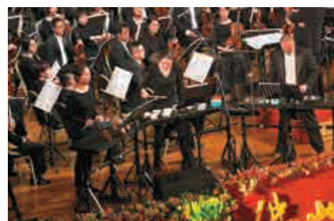
▲佛山新年音樂會演出安迪·秋保《功夫》協奏曲第二段的三位打擊樂手