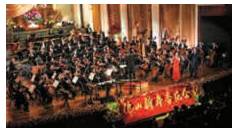
▲佛山新年音樂會最後加奏《最炫民族風》