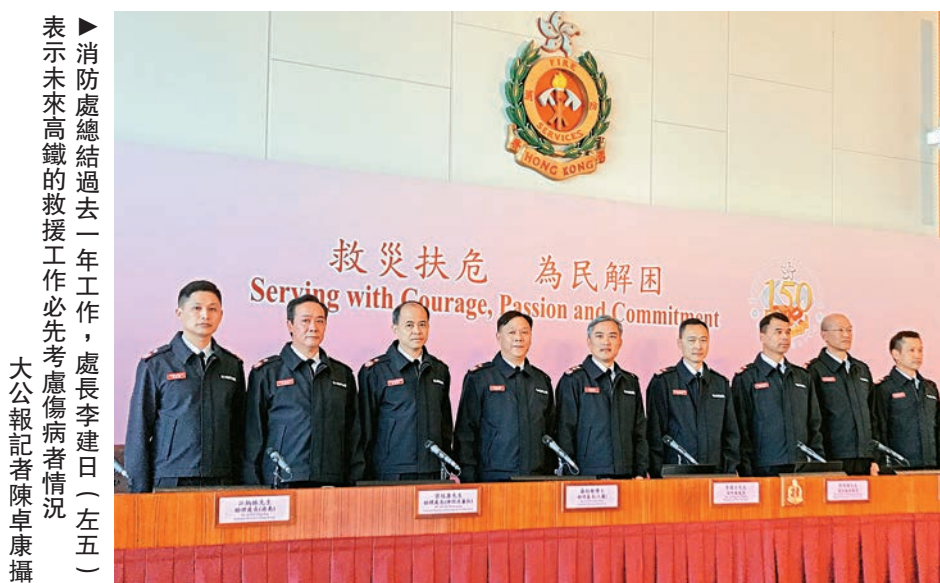
表示未來高鐵的救援工作必先考慮傷病者情況

清拆外牆僭建物的大規模行動，屋宇署寫明露台的僭建物問題，不屬於行動中的取締項目。但何鉅業強調，違例就是違例，屋宇署保留法律權力，向違例動工露台的業主，先發出勸喻信要求業主清拆露台僭建物，業主不遵從再發清拆命令，若業主再不遵從，屋宇署可代為清拆再向業主收回費用；若業主不遵從命令而沒有合理辯解，即屬犯法，一經定罪，可判最高罰款20萬元及監禁一年。