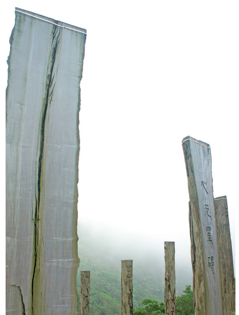
▲心經簡林山坡上最高位置的木柱(編號23)(左)之上並沒有刻字，乃是象徵《心經》「空」的要義

杜甫原詩「大廈如傾要棟樑，萬牛回首丘山重」，意指千年古柏之才，足以成為支撐大廈的棟樑，其分量之重以萬牛之力亦難撼動。在民生百業備受困窘之際，饒公引用「萬牛回首」，鼓勵社會各界似牛敦厚、踏實、壯健、耐勞，願港人積極面對，在各自