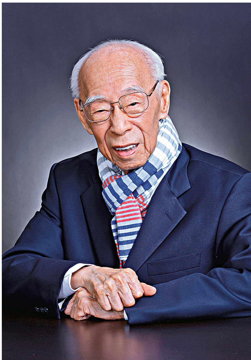
▲一代國學大師饒宗頤辭世，享年101歲