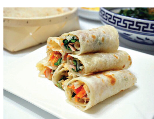
▲北方立春有吃春餅的習俗

餅，但是我從未光顧過，聽說他們家的春餅特別薄，可以透過春餅看清報紙上的字。不過從小我很少出去吃飯，所以一直沒有機會品嚐到它的美味。真希望現在就飛回哈爾濱品嚐這一口。