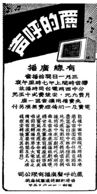
▲當年在報章上刊登的「麗的呼聲」廣告

時至今日，人們娛樂渠道多不勝數，電台廣播模式也必須與時並進才能生存，收聽電台節目也不再受到時空限制，因為聲音傳播已走向互聯網世界，再也不是收音機的專利也！