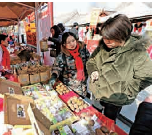
▲2月8日，西安民眾在電商年貨展上挑選年貨商品

此次規劃還提出，以西安國家中心城市和區域性重要節點城市建設為載體，打造全國重要的先進製造業、戰略性新興產業和現代服務業基地，輻射帶動西北及周邊地區發展。目前西安市正全力打造「3+1」萬億級產業，培育6個千億級戰略性新興產業集群。此次西安入列國家中心城市，未來必將成為引領西北地區發展的重要增長極。