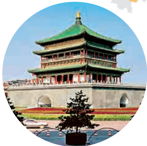
▲西安近日獲批成為中國第9個國家中心城市