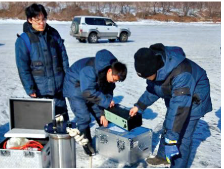
▲中俄高校聯合開啓高緯度海洋環境下的海冰聲學相關試驗研究

環境條件非常適合開展與海冰相關聲學試驗。試驗中，雙方共同進行淺海海冰區環境聲學、冰層散射及混響特性、氣槍聲源特性及傳播特性、冰層下聲通信等方面的共同研究和試驗，服務於高緯度淺海聲學環境研究及海冰區資源勘探。