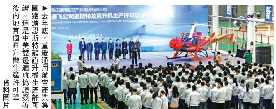
▲去年底，重慶通用航空產業集團獲准生產直升機，這是中美雙邊通用航空產業合作的重要標誌。圖為該集團生產的直升機在試飛中。

特朗普請楊潔篪轉達他對習近平主席的誠摯問候。特朗普表示，去年11月我對中國的國事訪問十分成功。美中關係非常重要。我贊同雙方應當落實好我同習主席北京會晤達成的共識和成果。美方願同中方加強合作，推動兩國關係取得更多積極進展。同日，楊潔篪在白宫會見美國總統國家安全事務助理麥克馬斯特和總統高級顧問庫什納，雙方就加強中美在重要邊境領域和國際地區問題上的合作交換意見。