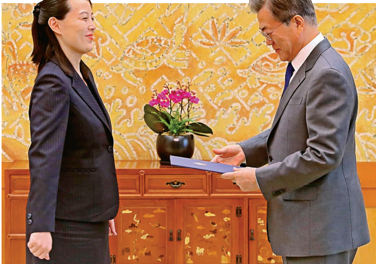
金與正(左)10日將金正恩親筆信交給文在寅