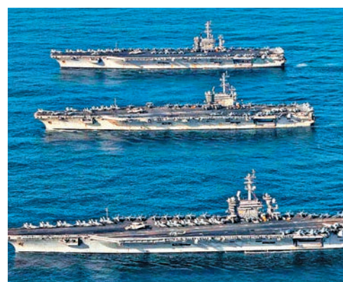
去年11月，美國海軍三艘核動力航母進入日本海

另據韓聯社報道，韓國總統府青瓦台高官10日透露，日本首相安倍晉三9日同韓國總統文在寅舉行首腦會談時提出，目前尚不是延遲韓美聯合軍演的階段，兩國軍演應照常進行。文在寅則指責，議題涉及韓國主權與內政，安倍不該親口言及該問題。