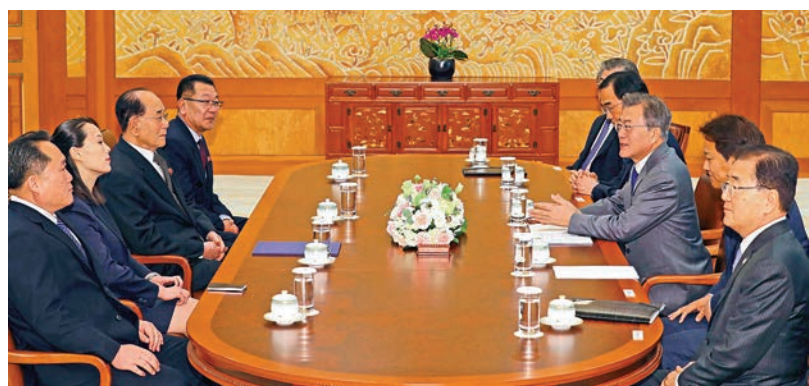
青瓦台與韓國總統文在寅(左)10日在會面

【大公報訊】綜合韓聯社、美聯社、新華社、英國《衛報》報道：韓國平昌冬奧會正式拉開帷幕之際，朝鮮「禮儀元首」金永南和朝鮮領導人金正恩的胞妹金與正率領代表團，到訪韓國總統府青瓦台，會晤韓國總統文在寅並共進午餐。其間，金與正向文在寅遞交金正恩親筆信，並轉達了他對文在寅訪問朝鮮的口頭邀請。文在寅回應稱會創造條件訪朝。文在寅還與朝鮮代表團一起觀看了韓朝女子冰球聯隊的比賽。