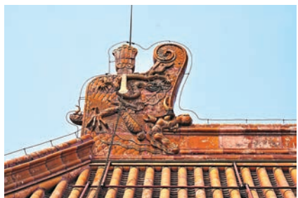
▲圖二：太和殿頂正脊兩端的大吻，為紫禁城內，也是中國現存最大者