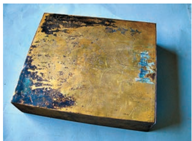
▲圖五：太和殿的寶匣，放置於正脊正中的脊筒內，難得一見