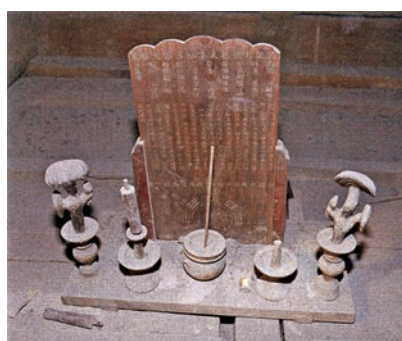
▲圖七：太和殿藻井上方供奉的符板（引自《故宮博物院院刊》2009年第5期）