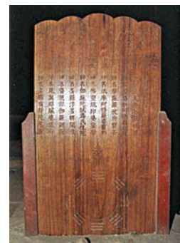
▲圖八：太和殿藻井上方供奉的符板近景