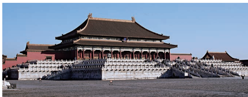
▲圖一：紫禁城內最重要的宮殿建築——太和殿，凡重大典禮在此舉行