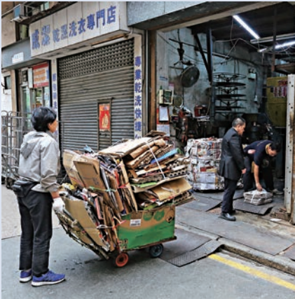
▲回收價再下跌幅影響賣紙人士執拾紙皮的意慾

全港共產生六萬噸廢紙，相當於平時一個月數量，當中至少兩萬噸廢紙受「休市」影響而囤積本地。 西灣河鰂魚涌街巷已見堆積 回收商新春「休市」期間，港島西灣河、鰂魚涌等街巷，連日來囤積大量紙皮。雖然部分廢紙、紙皮箱已經人處理，一層層疊起，但部分則隨意棄置於路邊，阻礙行人通道。 香港環保回收業總商會羅耀奎表示，本地回收商日前「啓市」已如常回收廢紙，但內地現時優先進口歐美地區的廢紙，料本地進口廢紙訂單數量愈來愈少，回收價短期內勢一直「插水」，估計正月十五後，即下月初起，廢紙回收價將由現時每噸900元，大幅下跌22%至700元，而前線回收價由每公斤六至七毫，跌至三至五毫。 綠惜地球環境倡議總監朱漢強稱，內地「廿四味」政策下月起全面實施，收緊禁止進口廢塑料、未經分揀的廢紙