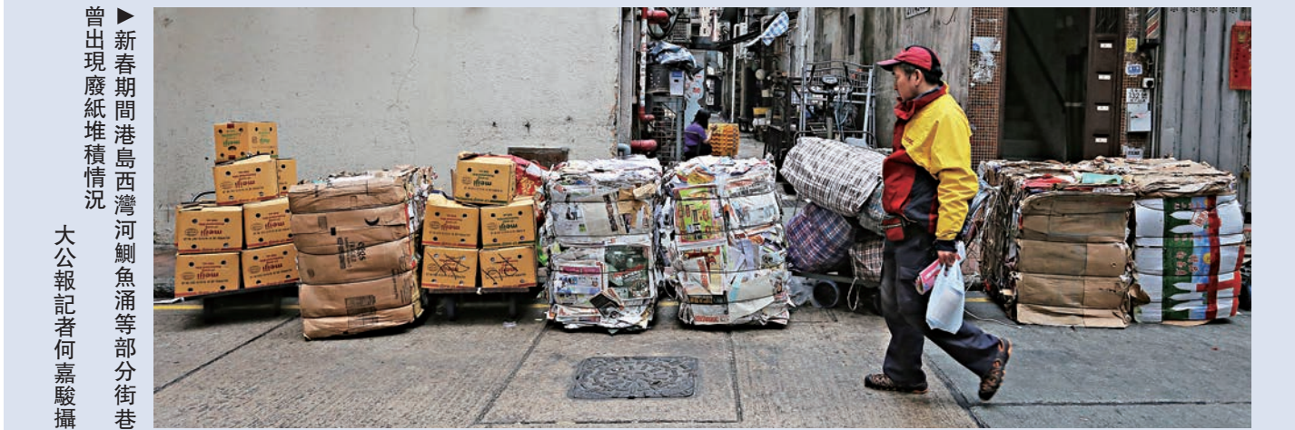
曾出現廢紙堆積情況