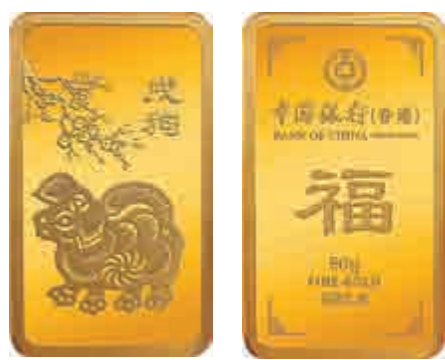
▲中銀香港首推的生肖金牌

選為郵票、首日封及明信片圖案。此外，金牌以瑞士精鑄鑄金工藝精鑄而成，由位於瑞士並擁有超過30年歷史的PAMP鑄造商鑄造。