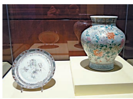
高劍父繪《粉彩螳螂紋碟》（左），其右為廣彩瓷《粉彩牡丹紋瓶》