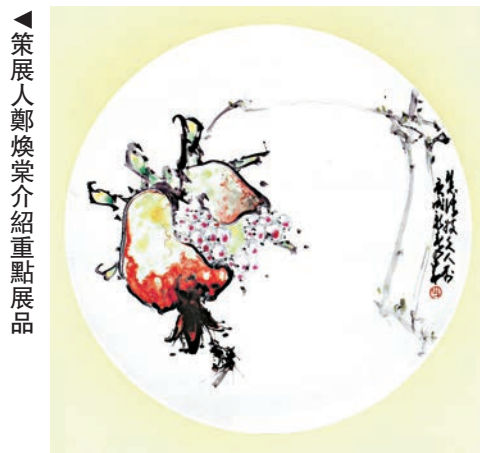
趙少昂彩繪瓷碟作品《石榴》