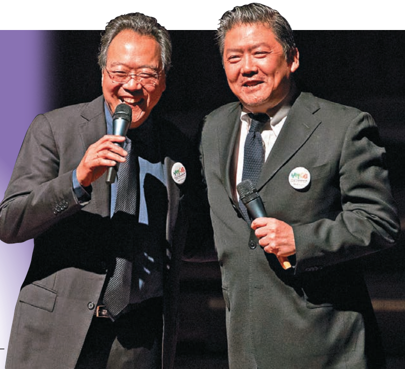
廣東國際青年音樂周開幕音樂會上馬友友（左）和余隆談笑風生