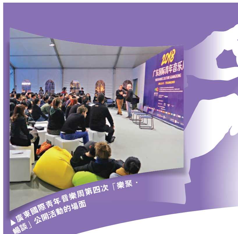
廣東國際青年音樂周第四次「樂聚·暢談」公開活動的場面

「2018年廣東國際青年音樂周」（YMCG），前後九天的活動在一月舉行，以二沙島上臨時搭建的蓬房音樂廳作為培訓基地，十五位導師和六位助教，為六十五名來自亞、歐、美、澳四大洲的華裔和非華裔青年音樂家提供訓練，最後一天安排在星海音樂廳舉行閉幕音樂會，可以說是音樂周的訓練成果匯報。