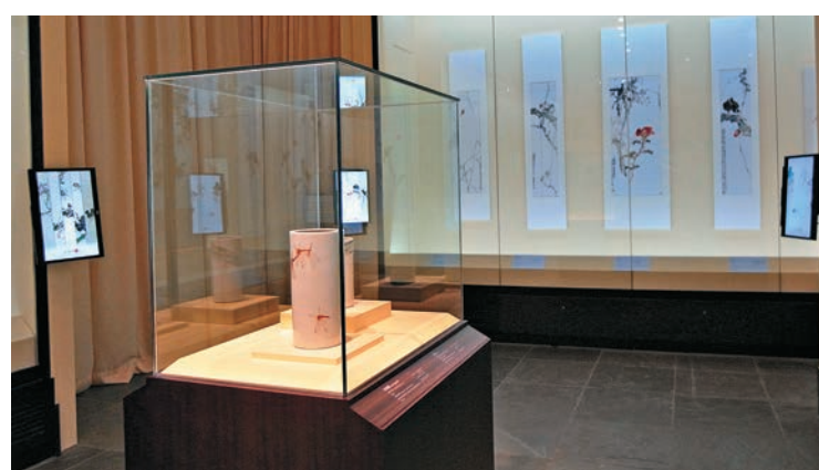
香港文化博物館「瓷緣·畫意」展廳一隅