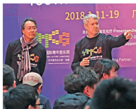
馬友友（左）與邁克爾·斯特恩在活動中和學員分享音樂經驗

這些活動都是為最後一天舉行的閉幕音樂會來設計，這場音樂會全名為「音樂馬拉松：從貝多芬到無限驚喜」，音樂會安排在與蓬房音樂廳一街之隔的星海音樂廳舉行。上半場由下午一時半至近五時半才結束。下半場由晚上七時半至近九時，由各弦樂導師及學員組成的樂團演奏《英雄》交響曲，也就是說合共五個半小時，這確可以說是「馬拉