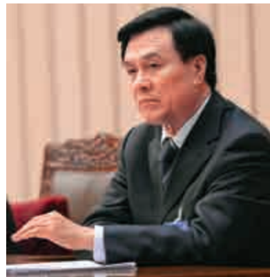
楊晶嚴重違紀受到留黨察看一年、行政撤職處分。

楊晶從2013至2017年10月出任中央書記處書記，國務委員、國務院黨組成員兼國務院秘書長、機關黨組書記，中央國家機關工委書記，國家行政學院院長。2017年10月至2018年2月，楊晶出任國務委員、國務院黨組成員兼國務院秘書長，國家行政學院院長，2018年2月24日被撤職。