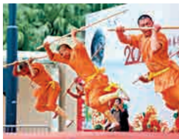
▲武僧團表演少林棍法，台下掌聲不斷

【大公報訊】記者楊州報導：「天下武功出少林」，廟會昨日首場表演節目便叫「天下少林」。