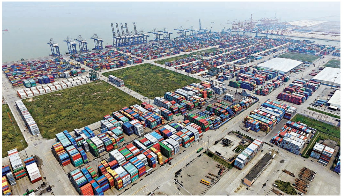
廣州要建設世界級海港，並在南沙等區域探索建設自由貿易港。圖為南沙港網絡圖片

至於南沙在大灣區綜合服務功能核心區功能，規劃提出要重點發展國際航運、國際服務貿易、國際創新金融、科技創新、國際交往等功能。規劃還顯示，南沙將建設粵港澳全面合作示範區，面向港澳實施更大程度的先行先試和更高水平的開放政策。南沙將加強與港澳在離岸貿易、高技術服務、教育培訓、高新技術產業、高端醫療產業等領域的合作。充分考慮港澳人士在南沙生活的需求，完善出入境、通關、居留等服務設施。