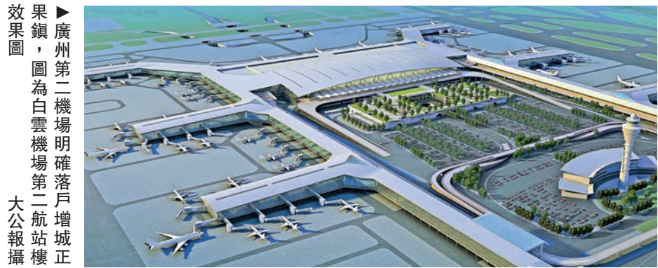
效果圖：廣州第二機場明確落戶增城正果鎮，圖為白雲機場第二航站樓