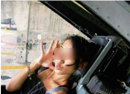
▲一名辣妹在F-16機艙的「嘟嘴照」暴露台軍紀律渙散 中時電子報

【大公報訊】台軍官在幾年前私帶友人進入軍營，並在F-16座艙裏拍照，涉及違反紀律，將受到相關懲處。但這並非台灣空軍首次發生這樣的醜事。在2015年一張台灣女星李倩蓉坐在阿帕奇直升機裏的照片也暴露了台軍軍紀渙散。當時台灣陸軍航空特戰指揮部601旅一名重要幹部私自帶李倩蓉到AH-64E阿帕奇直升機的修護廠房參觀，甚至還讓李倩蓉坐進機密等級相當高的駕駛艙，模擬駕駛AH-64E。