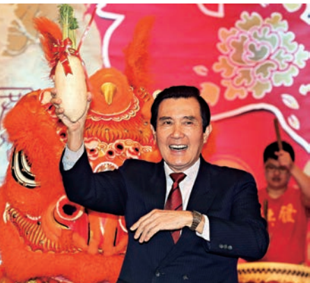
▲馬英九25日出席新同盟會2018年春節團拜聯誼活動

【大公報訊】據中社報道：前台灣地區領導人馬英九25日參加新同盟會春節團拜活動，談到兩岸關係，他表示，到目前爲止，兩岸統一的條件還沒成熟，雙方必須持續交流和互動，創造有利條件。