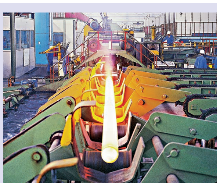
▲3500噸熱擠壓機，擠壓一根鋼管僅需1分鐘

廠，並先後開展了800、690和DJ631合金U形傳熱管的研製工作，對各個關鍵工序的主要參數和細節進行試驗和探索，固化了工藝參數，編製了產品製造大綱、質量計劃以及四十餘份工藝技術文件。次年6月8日，久立特材與國家核電上海核工程研究設計院共同簽署《AP1000系列核電蒸汽發生器用U形管國產化合作開發協議》，標誌着久立特材研發核電蒸汽發生器管進入實施階段。