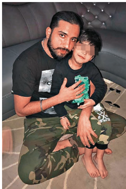
▲疑犯在fb上載與六歲兒子的合照