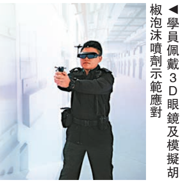
▲學員佩戴3D眼鏡及模擬胡椒泡沫噴劑示範應對

懲教署預計於2018/19年度全年招聘最少50名懲教主任及350名二級懲教助理，今年起，所有入職學員須接受虛擬實境（VR）訓練。懲教署獲政府創新及科技基金撥款180萬元，開發虛擬實境訓練系統，設有在囚者自殺、自殘、兩名在囚者打架，三個夜更巡邏工作時的突發情況，學員佩戴3D眼鏡及模擬胡椒泡沫噴劑示範應對，教官從旁評核檢視。