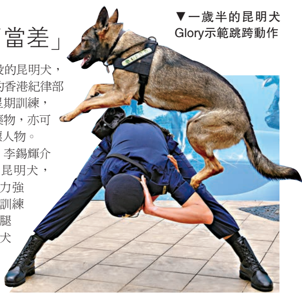
▼一歲半的昆明犬Glory示範跳跨動作

懲教署警衛犬隊現有七隻現役的昆明犬，是唯一從內地公安部引入昆明犬的香港紀律部隊。昆明犬於一歲時，需接受12星期訓練，完成後負責保安巡邏及嗅查危險藥物，亦可協助追截在逃人士，抓咬制服目標人物。懲教署懲教主任（警衛犬隊）李錫輝介紹稱，2010年起從內地引入四隻昆明犬，2015年再引入六隻，好處是適應力強，適合在溫暖潮濕的香港工作及訓練，而且服從性高，八歲前出現後腿關節問題的機會較小。懲教警衛犬隊現有29位成員，管理70頭犬，分駐六個小隊在不同院所工作。