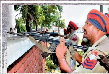
▲印度軍警在當日劫獄現場手持自動步槍戒備 網上圖片

印度恐怖分子在香港落網，成為國際新聞！本港警方偵查尖沙咀4.5億日圓街頭劫案，上周截獲疑犯，經核對資料驚揭是被國際刑警以「紅色通緝令」追緝的恐怖分子。印度傳媒披露，疑犯曾在香港設立「控制室」，策劃及遙控指揮前年轟動印度的劫獄案，印度當局正透過外交渠道，向香港特區政府提出引渡返國審訊的要求。保安局指香港面對恐襲風險仍維持「中度」級別，但會繼續加強反恐能力。懲教署亦將設反恐專組，應對恐怖主義對監獄帶來的潛在風險（見另稿）。