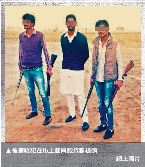
▲被捕疑犯在fb上載同袍持槍照