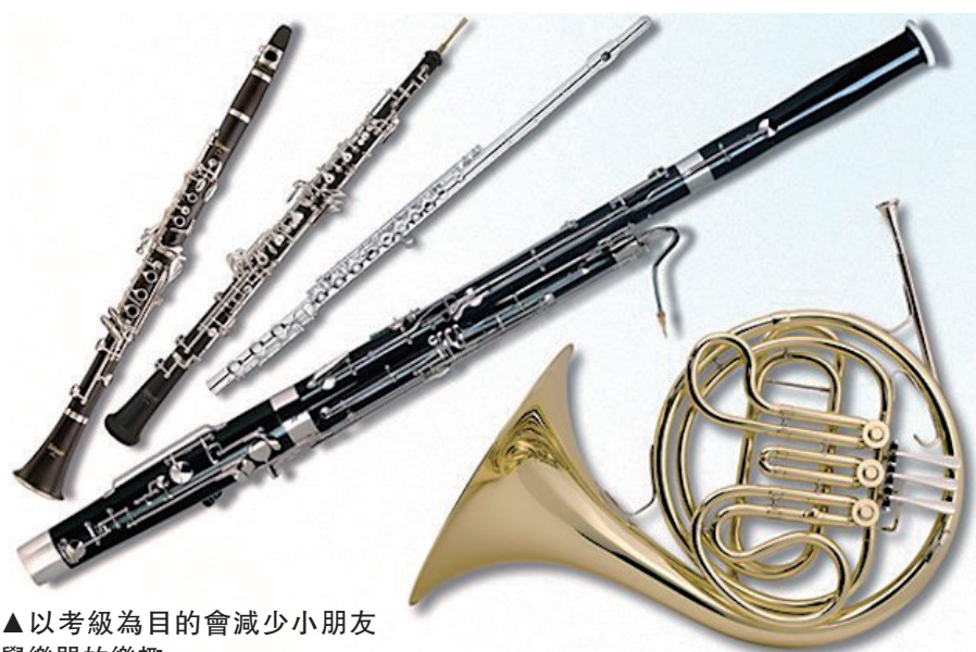
▲以考級為目的會減少小朋友學樂器的樂趣

法國號 (French Horn)： 法國號是銅管樂器，但傳統上它屬木管五重奏的