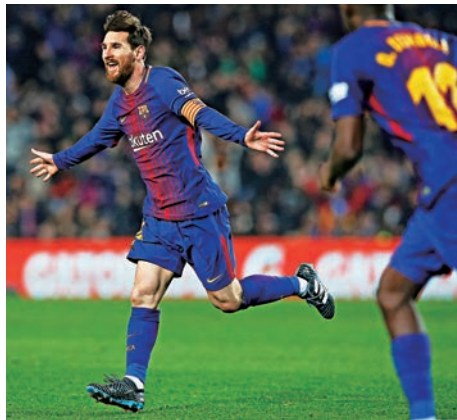
▲巴塞隊長美斯 資料圖片