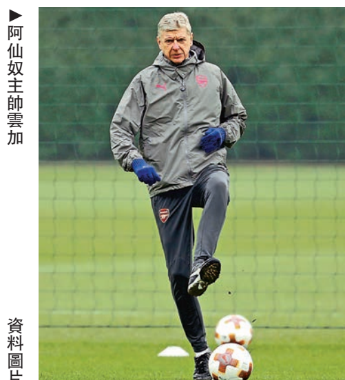
▲阿仙奴主帥雲加