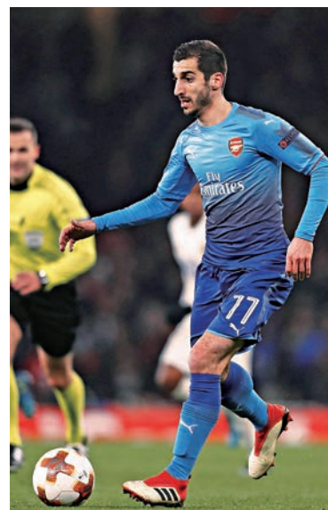
▲阿仙奴的米希達利恩可在今仗上陣 資料圖片