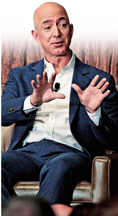
▲亞馬遜創辦人兼行政總裁貝索斯