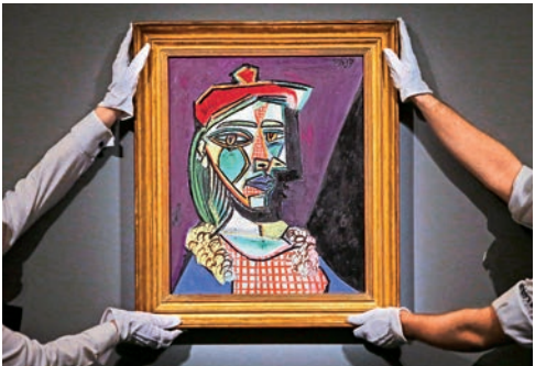
▲畢加索的這幅油畫創作於其巔峰時期 1937年

根據修訂案，防止外籍犯罪嫌疑入外逃的「緊急禁止出境」制度也將實施。屆時，被懷疑犯下死刑、無期徒刑或三年以上有期徒刑的犯罪行為的外國人，韓國偵查機關可禁止其出境。另外，為防止有犯罪危險的轉機旅客非法入境，出入境事務管理部可索取外國旅客的個人信息。