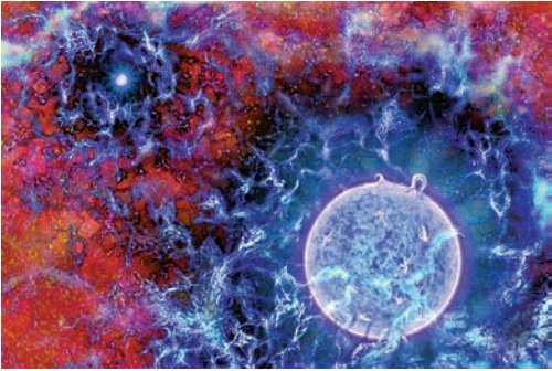
▲宇宙第一顆星球開始形成的想像圖

無線電噪音當中萬分之一的部分，有如大海撈針。接收天線亦要放置在西澳甚少人工無線電波干擾的偏遠地區，有報道指，該接收天線大小如一張四人餐桌。據了解，恆星發出的紫外線，會改變周圍氫氣的特性，令氫氣吸收到宇宙大爆炸餘暉而產生無線電波，此無線電波讓地球的儀器也偵測得到。有關發現刊登於美國《自然》（Nature）科學期刊。