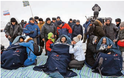
▲三名太空人着陆後，工作人員為其裹上毯子、測量脈搏