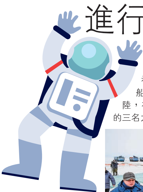
▶地面工作人員正在進行飛船的接收工作

【大公報訊】綜合美聯社及法新社報道：俄羅斯「聯盟MS-06」號飛船2月28日清晨成功在哈薩克斯坦境內着陆，在國際太空站（ISS）工作了五個半月的三名太空人搭乘飛船安全返回地球。