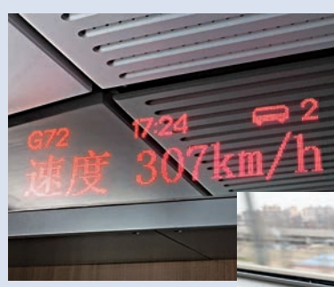
▶高鐵路平穩，硬幣立起可10秒不倒

全國政協委員龍子明則通過看報對香港的傳媒行業發展有感而發。他說，如今香港媒體大多局限於本地，而《大公報》和《文匯報》可在全國發行，報道亦十分權威，有潛力走向國際，希望能夠再接再厲，在國外打響香港傳媒的品牌。