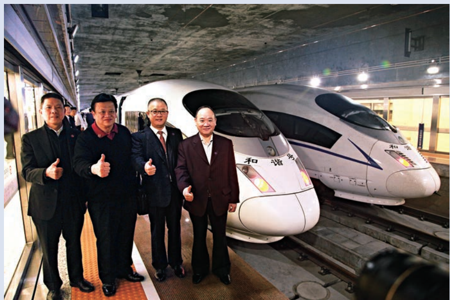
▲委員上車前在高鐵旁合影留念

什麼是風馳電掣、呼嘯奔馳？約30名組團乘高鐵上京出席全國兩會的港區全國人大代表和全國政協委員昨日便親身感受了一番，11小時從深圳橫跨大半個祖國抵達首都北京。旅途中，列車的平穩安全和分秒不差的時間表讓代表和委員們讚嘆不已。他們紛紛表示，香港加入國家高鐵網絡對港人是重大利好，而只有實行「一地兩檢」才能發揮出高鐵香港段的最大效益，期待「一地兩檢」本地立法能夠順利完成。