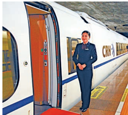
▲列車停在福田站，工作人員笑臉迎接乘員上車

經過四個小時後，由於早上起得早，大家都有些飢腸轆轆。有傳媒家在列車靠站時，情不自禁地說：「怎麼沒有雞腿？沒有花生、零食在站邊售賣？」這句話立即引起車廂內許多70後、80後的回憶，因為在高鐵還沒面世的很長一段時間裏，火車是我