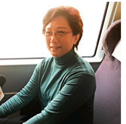
▲屈恩表示，會經常乘坐高鐵，還會帶上孩子和公司同事組團乘搭高鐵路