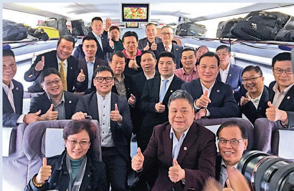
▲列車的平穩安全和分秒不差的時間表讓代表和委員們讚嘆不已

昨早七時，一輛前往北京西站的高鐵列車準時地從深圳福田站駛出。列車上，一眾代表、委員在車間暢談時事，在車廂走動之時，大家如履平地，完全沒有受列車高速行進的影響。