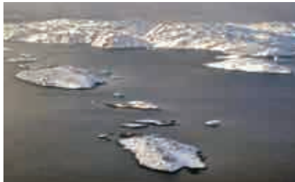
▲今年北極氣溫異常溫暖，格陵蘭島上冰層融化

在北極圈以南的歐洲，近日卻受到寒流吹襲，已導致數十人死亡。早在1973年時就有研究指出，北冰洋若無冰，其以南地區就可能較平常冷。氣候學家稱這類氣候現象為「北極暖、歐陸冷」（WACC）。德國漢堡大學教授卡雷希克在推特（Twitter）指：「這種古怪天氣會以駭人的強度和時間持續。」同時警示道：「問題是，這種天氣出現的頻率會不會增加？」