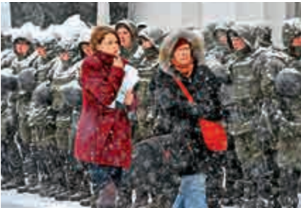
▲烏克蘭1日下大雪，議會外安保人員頭頂積雪

據報道，上月28日晚，日本放送協會（NHK）苦小牧支局一名28歲男記者，駕車外出時被困於大雪中，遂向汽車服務公司求助，後者隨即派三人到場，不料他們也同遭大雪圍困。三人曾要求公司派出除雪車協助清理積雪，但眼見除雪車久未到來，其中一名職員便自告奮勇下車搜索該記者，同日下午警方接報其失蹤。警方在本月2日凌晨發現男職員，並將他送醫院，惟最終不治，另外兩名職員及記者獲救。