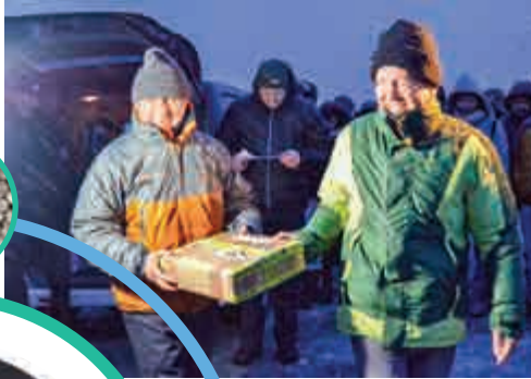
▲智利人員上月26日將種子樣本存入全球種子庫