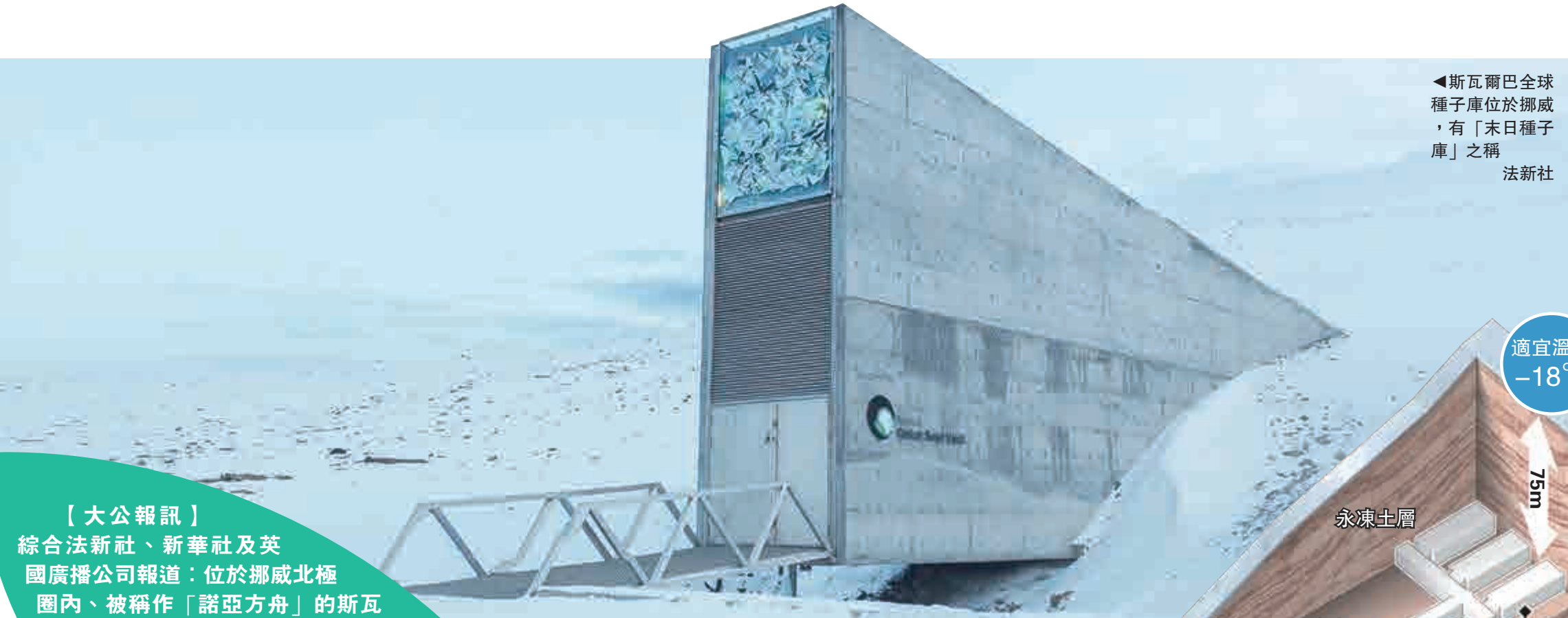
◀斯瓦爾巴全球種子庫位於挪威，有「末日種子庫」之稱

【大公報訊】綜合法新社、新華社及英國廣播公司報道：位於挪威北極圈內、被稱作「諾亞方舟」的斯瓦爾巴全球種子庫（Svalbard Global Seed Vault）2月26日迎來啟用10周年慶典。當天又有逾7.6萬份種子樣本新加入種子庫，使得庫存的種子樣本數達到近106萬份。此外，因全球氣候變暖對種子庫構成威脅，挪威政府宣布，將撥款1270萬美元（約9910萬港元）對其進行修繕升級。