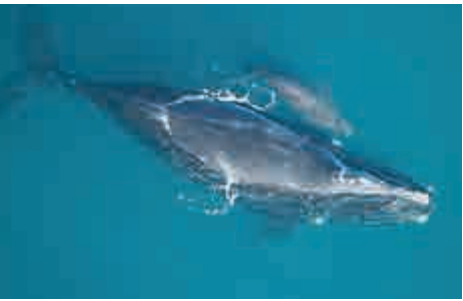
▲目前世界僅剩430隻露脊鯨，其中只有100隻潛在母鯨

企鵝「夫妻」會被迫離開它們目前的繁殖地，屆時其覓食旅程會變長。專家指出，對於王企鵝來說，若覓食距離太遠，它們的寶寶可能還沒等來食物就已餓死。