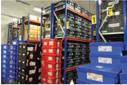
▲斯瓦爾巴全球種子庫可保存45億份樣本

2016年，全球經歷有紀錄以來最熱的一年。當年10月，因永凍土層融化，融水滲入全球種子庫入口處並向內蔓延了15米，雖未有造成任何影響，但已令當地政府重新檢討現有設施是否足以應付日後極端天氣帶來的傷害。