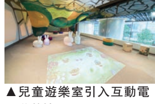
▲兒童遊樂室引入互動電子遊戲機