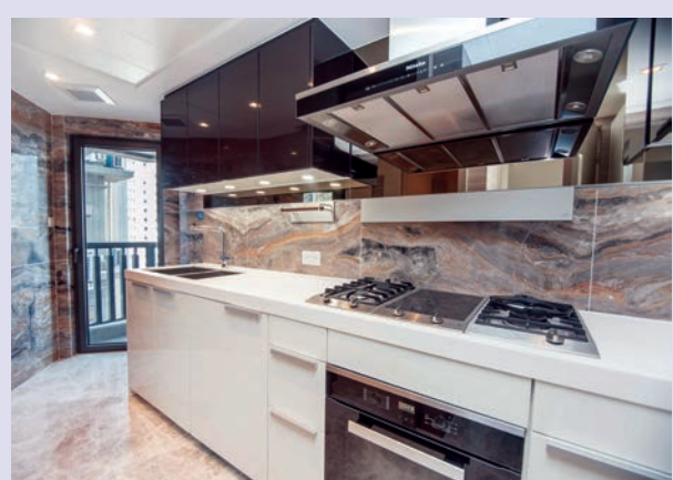
▲廚房齊備各式各樣名牌電器