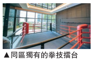
▲同區獨有的拳技擂台