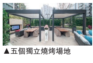
▲五個獨立燒烤場地

新地（00016）將軍澳南壓軸臨海住宅項目海天晉新近落成，早前已安排業主陸續入伙，項目延續系列的時尚型格氣派，用料及會所配套更有所提升，配合將軍澳南發展日益完善的社區配套，包括港鐵站、商場、酒店、海濱長廊及國際學校等，以及應有盡有的住客會所，海天晉堪稱完美的化身。