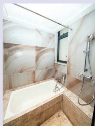
▲浴室配置四件頭裝置