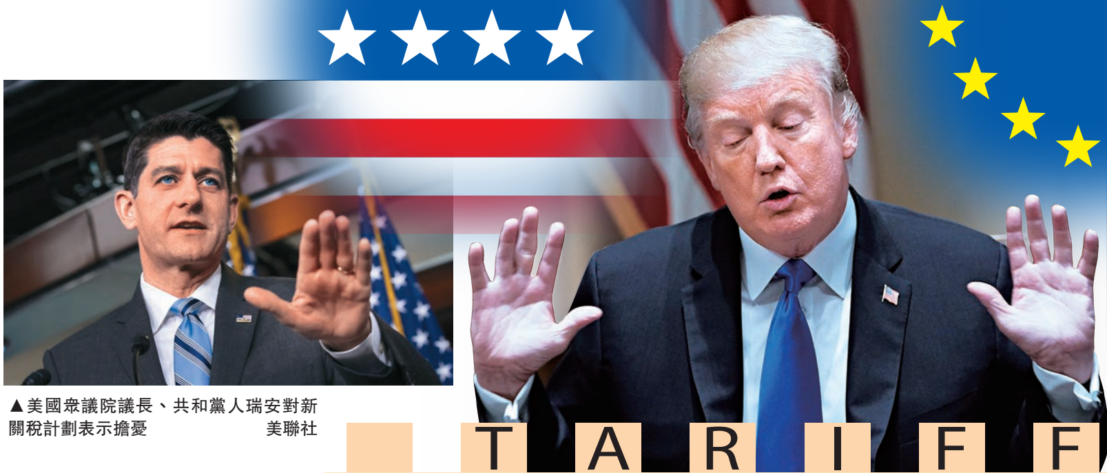
▲美國眾議院議長、共和黨人瑞安對新關稅計劃表示擔憂