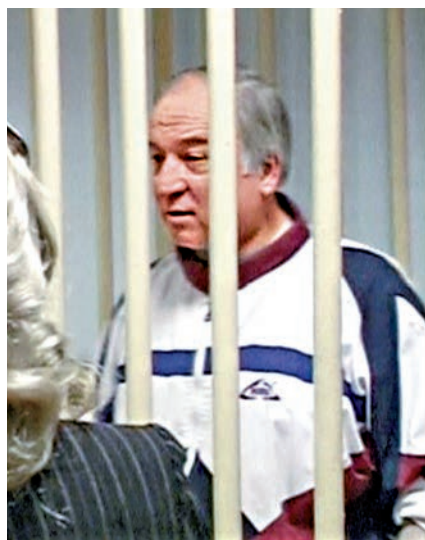
▲俄籍前間諜斯克里帕爾2006年在莫斯科出庭

俄總統普京的發言人佩斯科夫表示，俄方願意就此事提供協助，但本身並不掌握任何相關信息。英國外長約翰遜稱，如果俄當局是事件幕後黑手，英方將「以正常方式」前往今年的俄羅斯世界杯。俄外交部則回應指約翰遜的言論「荒謬」。