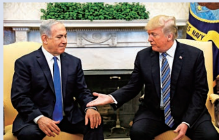
▲特朗普5日會見內塔尼亞胡

特朗普5月如果成行，勢將美以關係推向新高度，但也將面對來自其他國家更嚴峻的外交挑戰。另有分析指，以色列對特朗普和美國的擔憂正在加劇，原因之一是美國目前正默認以「宿敵」伊朗的影響力不斷提升。