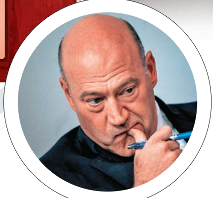
▲白宮國家經濟委員會主任科恩日前辭職，引發美國商界憂慮 資料圖片